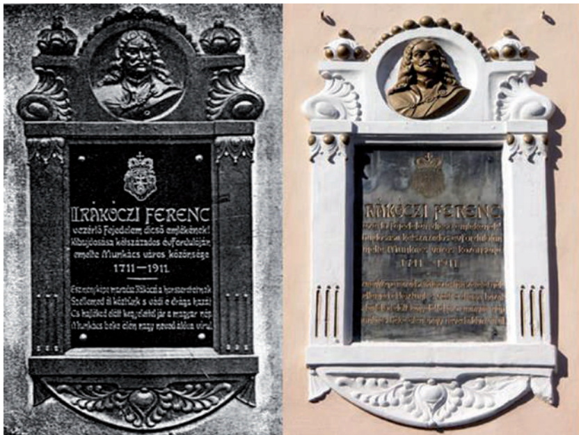
Az eredeti és a felújított tábla