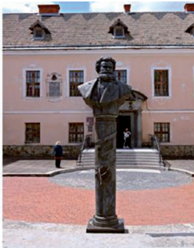
A Munkácsy-szobor eredeti és új helyén.

Szomorúan állapíthatjuk meg, hogy Munkácsy Mihály emlékének szülővárosában viszontagságos sors jutott osztályrészül. A háborús események, a politikai változások miatt elmaradt szoboravatás, az elkallódott eredeti emléktábla, majd pedig mellszobrának száműzése a főtérről méltatlan a világhírű festő emlékéhez, egy olyan személyiség emlékéhez, aki a város nevét halhatatlanná tette, akinek köszönhetően a földkerekség művészeti életében számon tartják Munkács városát.