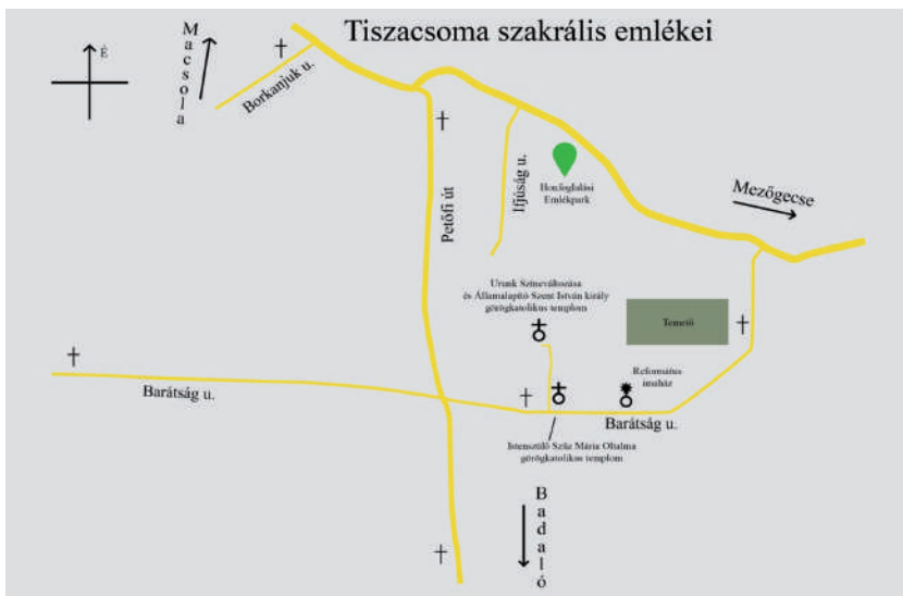
A térkép saját szerkesztés

„Az útmenti kereszték olyan szilárd és állandó jelek, amelyek a táj, a terület emberének tájékozódási eszközei, noha eredetileg elsősorban kegyeleti és vallásos szándék hozta létre őket. Az útmenti kereszték többnyire jól látható helyen (út mellett, utak kereszteződésében, határdombon stb.) állva erőteljes, egyszerű formáikkal harmonikusan illeszkednek a tájba, a térben eligazítanak. Esetleg emlékeztetnek régi eseményre, vagy éppen egyéni fogadalom jelképeként hívő embereket, dolguk után sietőket intenek jámbor életre vagy csak futó áhítatra” 7 . A Tiszacsoma területén álló keresztkeknek a településen elfoglalt helye is az általános modellt követi. Temetői és a templom előtt vagy mellett álló keresztet szinte minden katolikus közösséggel is rendelkező településen találunk, ahogyan megszokott dolog a településre be- vagy onnan kivezető utak mentén is keresztet állítani 8 . A faluban álló 7 kereszt közül egy a temetőben, egy a falu régi temploma előtt, egy-egy a falu főutcájának két végén, három pedig lakóházak telkén belül áll.