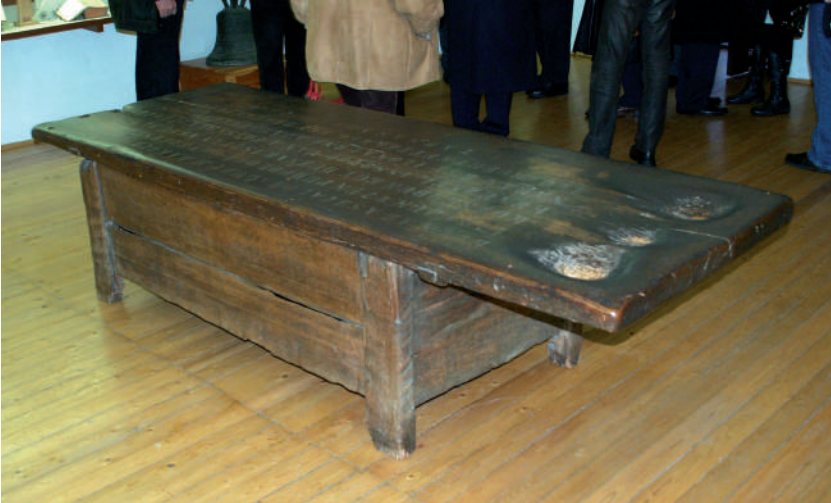
A Rákóczi-asztal Sárospatakon, a kollégium gyűjteményében.

sítése után a létrejött új község a Vezérlő Fejedelem iránti tiszteletből kapta a Vezérszállás nevet. A névadás nem volt véletlen.