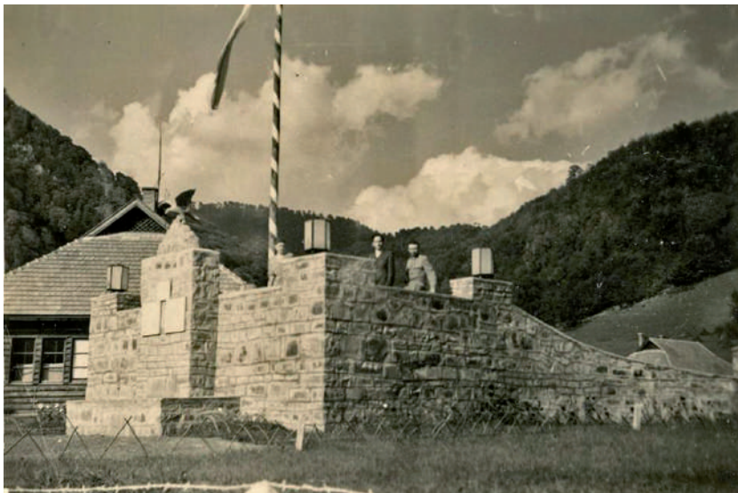
A vezérszállási Országzászló Emlékmű.

Sajnos bővebb információra nem sikerült bukkanni. A szovjet korszakban ez az emlékmű is osztozott a többi hasonló emlékmű sorsában. Lerombolták.