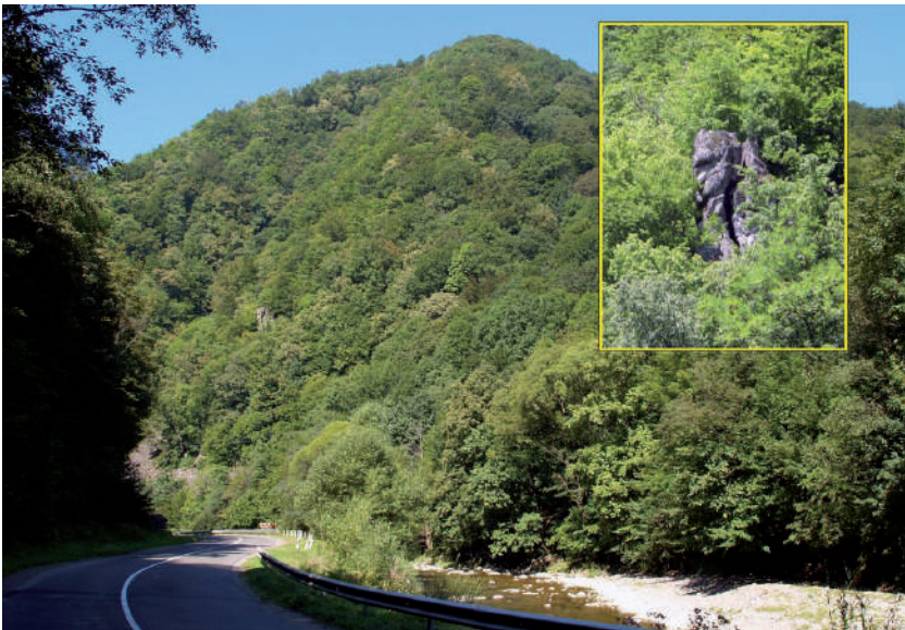
A Vereckei-szoros legszűkebb része a Napóleon-szirttel.

A Latorca folyó által kialakított Vereckei-szoros legkülönösebb szakasza Vezérszállás északi szélén van. Itt, ahol az irdatlan hegyek szinte teljesen öszszezárnak, a Latorca szemérmesen karcsúbbá válik, mindössze annyi rést tör magának, hogy, gondolva az utazókra, még az út is elférjen. Majd a félelmetes hegyek közül kiszabadulva, a sziklás mederben harsogó csobogással hirdeti a hegyek fölött aratott győzelmét. A szoros legszűkebb részén vezető útról jól kivehető a folyó túlsó partján, a fák közül meredező – Napóleon-sziklaként