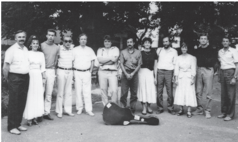
József Attila Alkotóközösség előadói körúton, 1988.

Én egy évvel később diplomáztam és lettem a Kárpáti Igaz Szó munkatársa, 1984-től a Kárpáti Kiadó szerkesztője. Majd 1992-től az Intermix Kiadó vezetője.