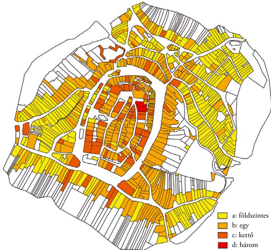
Az épületek magassága, 1851