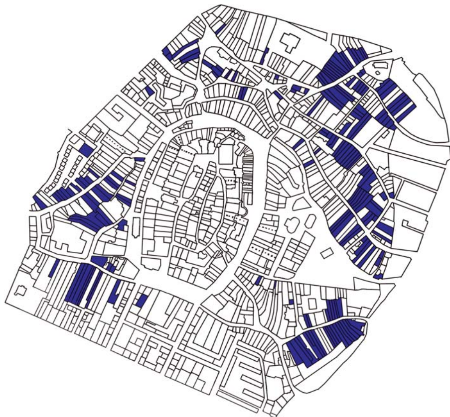
Fésűs beépítésű telkek, 2001